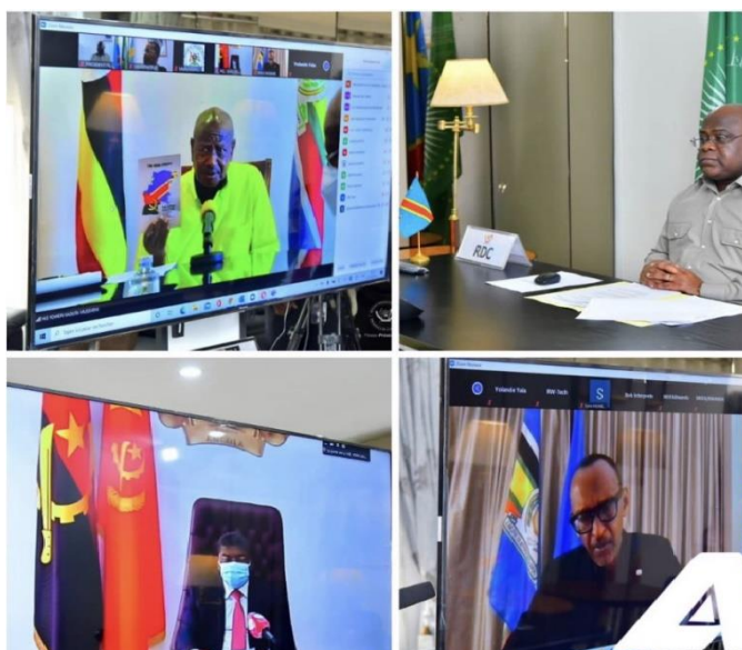
Evariste Ndayishimiye avait boudé à deux reprises l'invitation pour le sommet de la CIRGL de Goma convoqué par le président de la RDC