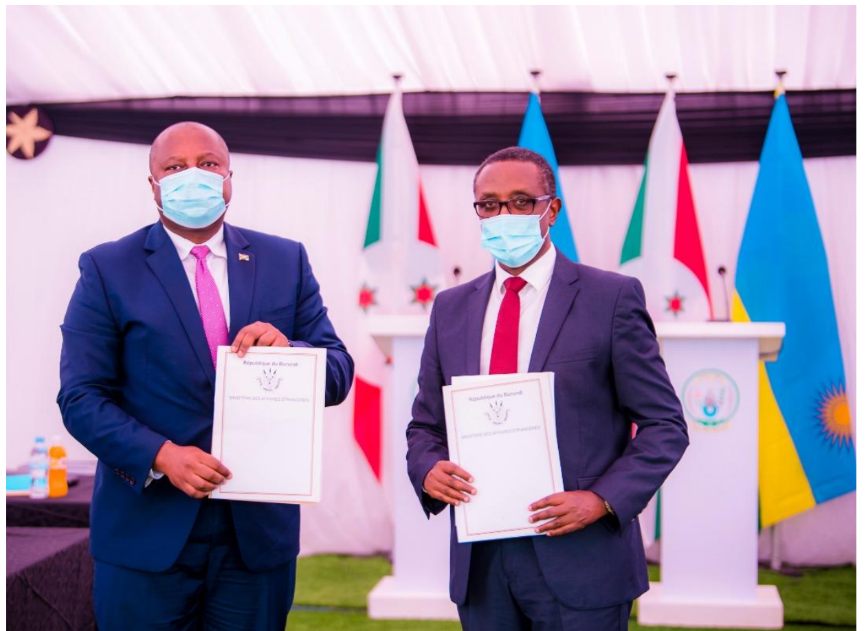
Rencontre entre les chefs de la diplomatie du Burundi et du Rwanda (Albert Shingiro et Vincent Biruta) le 20 octobre 2020 au poste frontière de Nemba-Gasenyi. Les relations diplomatiques entre ces deux pays se sont dégradées depuis 2015

Le Mouvement d' Actions Patriotiques, MAP-BURUNDI BUHIRE suit avec beaucoup d' inquiétude la succession des développements alarmants qui émaillent la vie politique du Burundi depuis l' arrivée au pouvoir du Général-Major Evariste Ndayishimiye. Lors de la Conférence-débat sur les 100 premiers jours du régime Ndayishimiye que MAP-BURUNDI BUHIRE a organisé le 25 septembre 2020, plus de 200 participants provenant de 13 pays différents, ont souligné de nombreux signes inquiétants de dérapages qui, si rien n' était fait pour les juguler, risquaient d' entraîner le Burundi vers un gouffre dont il serait difficile de sortir. Ils ont alerté l' opinion nationale et internationale, en vue d' endiguer cette regrettable descente aux enfers. L' évolution politique de ces deux dernières semaines, en particulier, l' appel fait par le Président de la République, aux miliciens Imbonerakure de s' impliquer avec plus d' ardeur dans leurs sales besognes de répression de la population, pendant que le Secrétaire Général des Nations Unies demandait au Président Ndayishimiye de démanteler ces milices et de les intégrer dans la vie active. Cela confirme évidemment les préoccupations de MAP-BURUNDI BUHIRE. C' est la raison d' être de cette Revue des développements politiques au Burundi, qui se veut mensuelle et vise à informer, prendre le pool de la situation, et alerter sur les dérives du régime en place au Burundi.