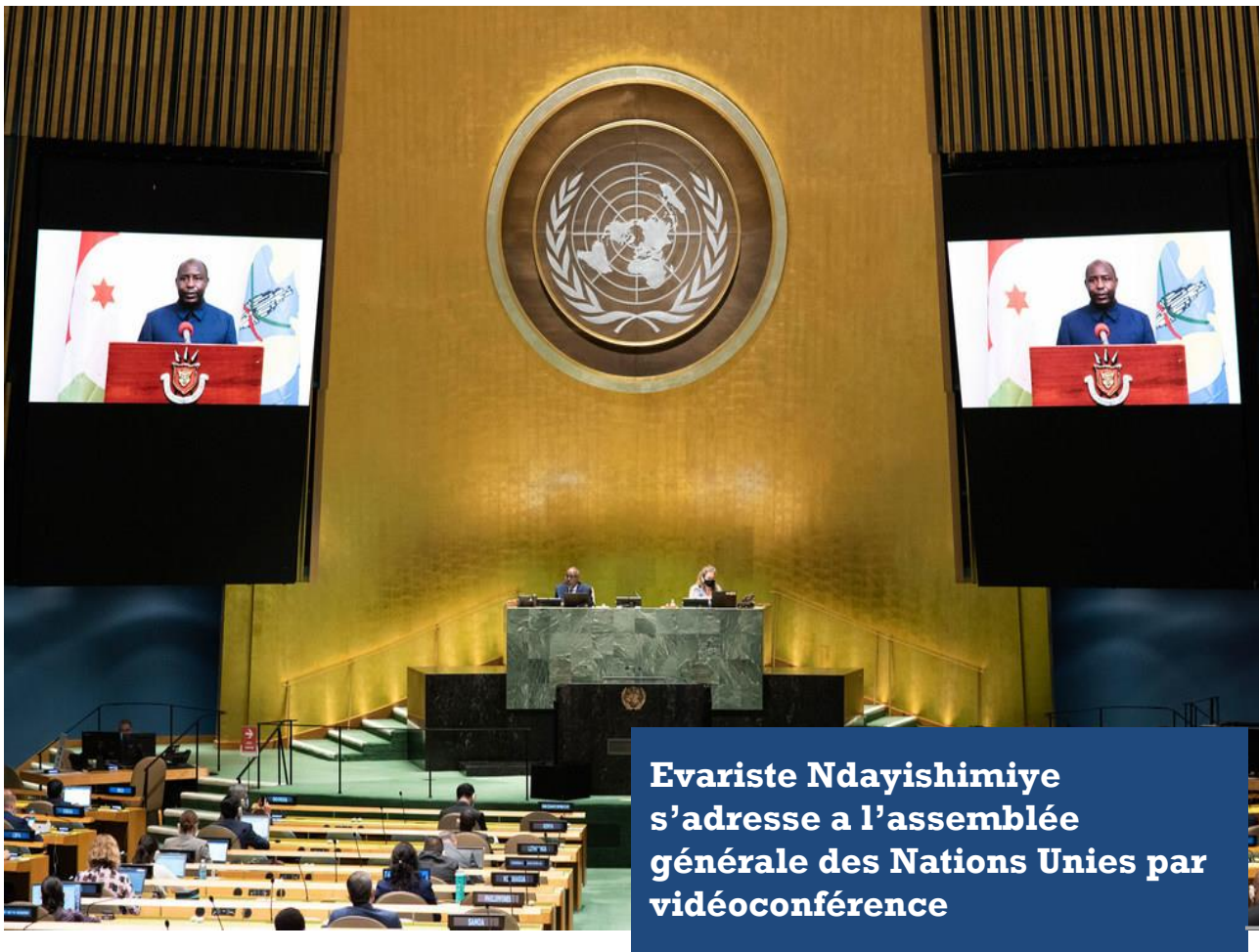
Evariste Ndayishimiye s'adresse à l'assemblée générale des Nations Unies par vidéoconférence

Tout cela au moment où de tous les horizons, tous appellent au démantèlement de ces horribles escadrons de la mort. Ces milices sont littéralement en train de miner les objectifs claironnés comme constituant les soubassements de l'Agenda du développement durable 2030 : lutte contre la pauvreté, promotion de la bonne gouvernance, développement du capital humain, lutte contre le détournement des biens de l'État, etc. De surcroît, le Président Ndayishimiye compte fermer définitivement le Bureau de l'Envoyé Spécial du Secrétaire Général des Nations Unies au Burundi, estimant que la situation paisible prévalant au Burundi ne le justifie plus et que par conséquent ce bureau sera fermé au 31 décembre 2020.