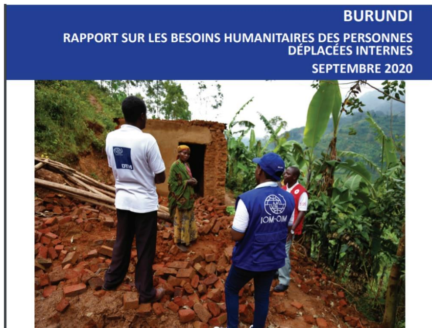
La situation des réfugiés et déplacés intérieurs est alarmante. Aujourd'hui, le gouvernement en fait un instrument politique