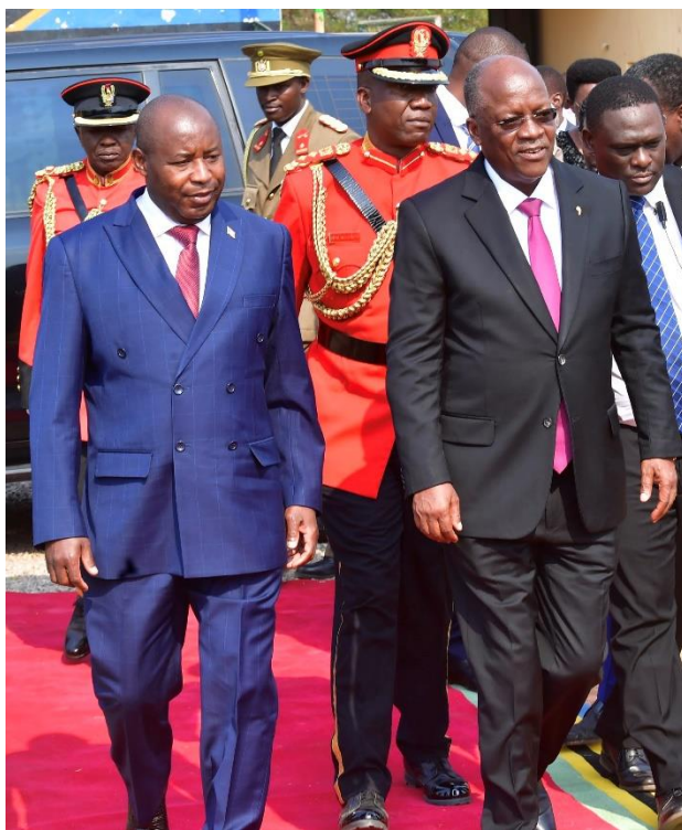
Pour sa première visite, le président Ndayishimiye a choisi Kigoma (Tanzanie). Il a été accueilli par son homologue Tanzanien, John Pombe Magufuli

Alors que le Secrétaire général de l'ONU a réitéré son appel pressant pour rappeler les dirigeants burundais à l'ordre, ces derniers viennent d'organiser la Semaine dédiée au Combattant. Le Président de la République s'est mué en Chef de Parti, ou plutôt, en Chef de milice, pour aller encourager les tristement célèbres milices Imbonerakure à poursuivre avec ardeur leur quadrillage du territoire et harcèlement des paisibles populations.